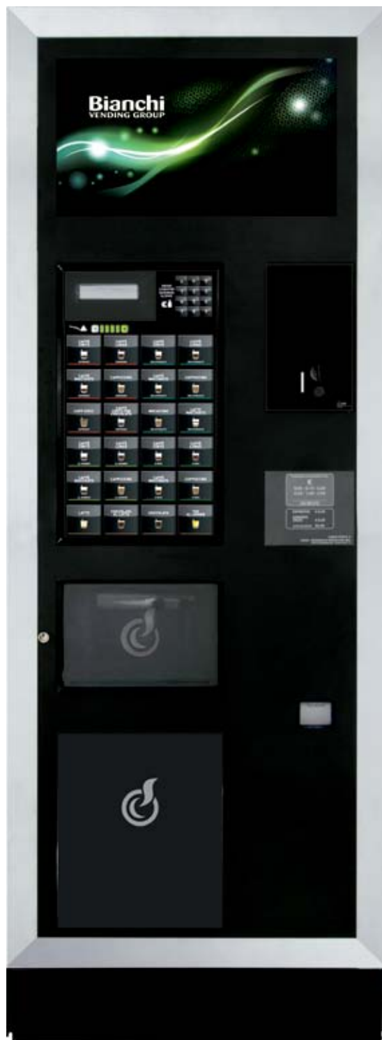
LEI500 L B.SMART

LEI500 L NEUES VENDING DESIGN, WELCHES IM BAUKASTENSYSTEM KONZIPIERT, FLEXIBEL UND KOMMUNIKATIONSSTARK IST.