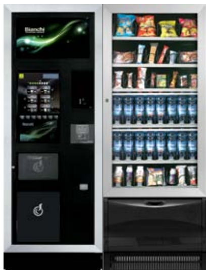
LEI500 L B.TOUCH + VISTA L